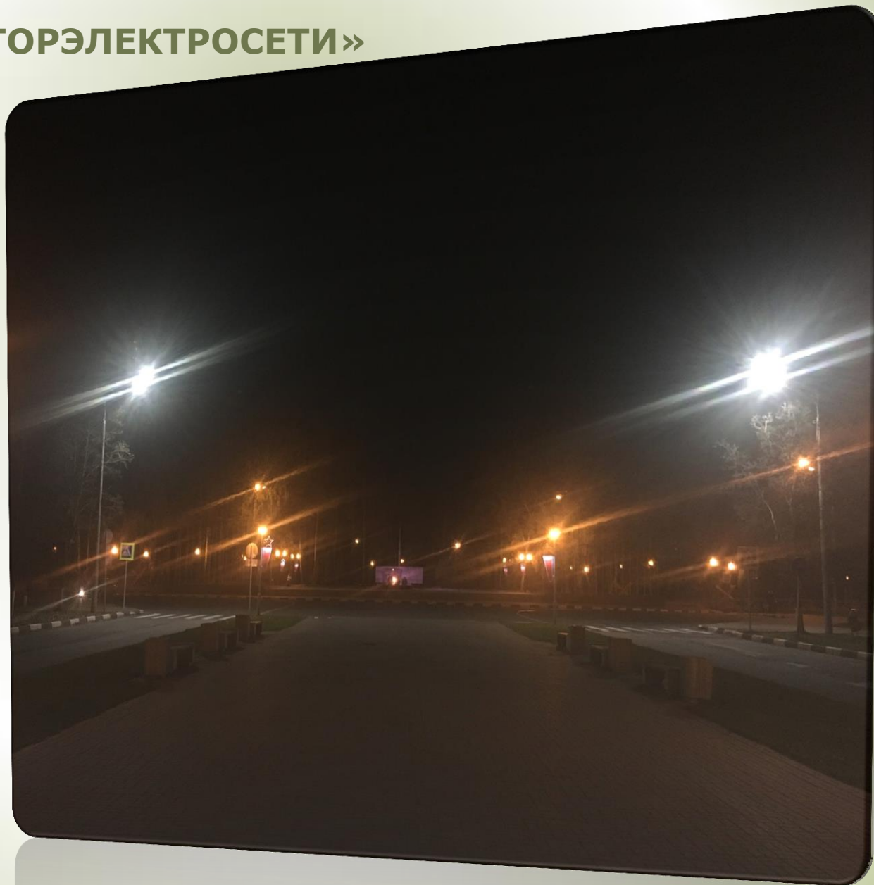
Освещение перехода Вечный огонь